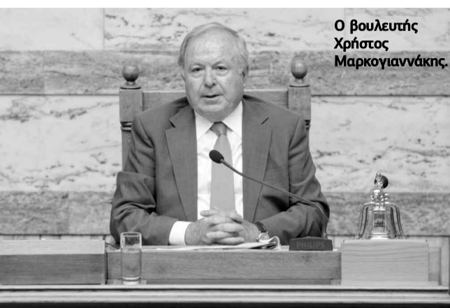
Ο βουλευτής Χρήστος Μαρκογιαννάκης.

«Παταγώδη αποτυχία είχε η καταπολέμηση του δάκου στην Αντιπεριφέρεια Χανίων κατά την τρέχουσα ελαιοκομική περίοδο, όπως καταγγέλλεται από τους δημάρχους και άλλους Φορείς».